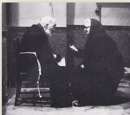
(Don Gabriele Amort vallomása Pio atyáról)

„Ó, Uram, múltamat irgalmadba, jelenemet szeretetedre, jövőmet gondviselésedre bízom.”